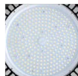
Ópticas 60°/90°/120°. 60°/90°/120° lenses. Optiques 60°/90°/120°. Consult. ref.