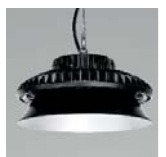
Reflector iluminación confort (120°). Comfort lighting reflector (120°). Anneau reflecteur confort (120°). Consult. ref.