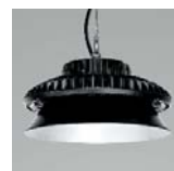
Anillo antideslumbramiento (120°). Anti-glare ring (120°). Anneau anti-éblouissement (120°). Consult. ref.