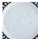
Ópticas 60°/90°. 60°/90° lenses. Optiques 60°/90°. Consult. ref.