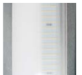
Varios difusores. Different screens. Plusieurs diffuseurs.