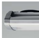
Acabados de calidad. Quality materials. Finition de qualité.