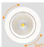
Giro horizontal 360°. 360° horizontal rotation. Rotation horizontale 360°.