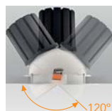
Giro vertical 120°. 120° vertical rotation. Rotation verticale 120°.