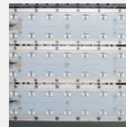
LEDs de gran potencia. High power LEDs. LED d'haute puissance.