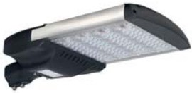
LONDON CITY 150W