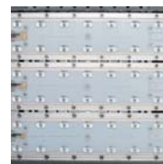
LEDs de gran potencia. High power LEDs. LED d'haute puissance.