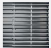
Gran disipación. Great dissipation. Grande dissipation.