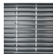
Gran disipación. Great dissipation. Grande dissipation.