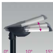
Ajustable entre 0° y 15° (vertical). Adjustable between 0° and 15° (V). Rotation entre 0° et 15° (V).