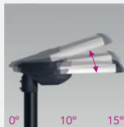
Ajustable entre 0° y 15° (vertical). Adjustable between 0° and 15° (V). Rotation entre 0° et 15° (V).