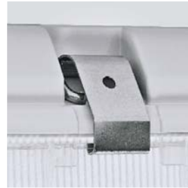
3 Clips de cierre (acero inox). Opcional. Closing clips (stainless steel). Optional. Clips de verrouillage (acier inox). Optionnel.