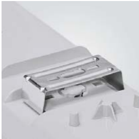
1 Clips fijación superficie (acero inox). Clips for direct surface fixing (stainless steel). Clips pour fixer sur le plafond (acier inox).