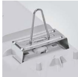
2 Clips para suspensión (acero inox). Opcional. Clips for suspension (stainless steel). Optional. Clips pour suspension (acier inox). Optionnel.