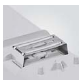
Clips fijación superficie (acero inox). Clips for direct surface fixing (stainless steel). Clips pour fixer sur le plafond (acier inox).