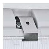
Clips de cierre (acero inox). Opcional Closing clips (stainless steel). Optional Clips pour suspension (acier inox). Optionnel