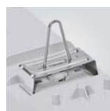
Clips para suspensión (acero inox). Opcional. Clips for suspension (stainless steel). Optional. Clips pour suspension (acier inox). Optionnel.