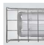
Rejilla de protección. Opcional. Protective grille. Optional. Grille de protection. Optionnel